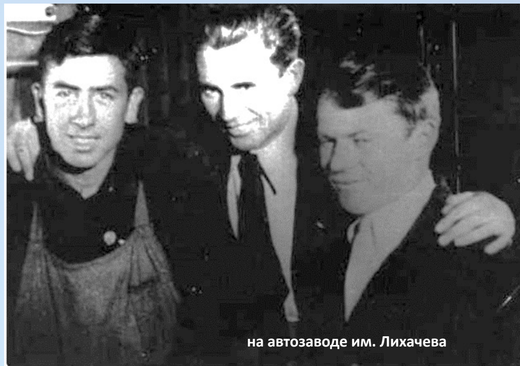
на автозаводе им. Лихачева