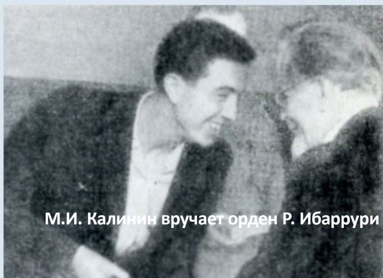
М.И. Калинин вручает орден Р. Ибаррури

И снова оказывается на острие войны, попадает в ожесточенные бои под Сталинградом. 35 стрелковая дивизия. в состав которой был включён Рубен Ибаррури только подходила к городу, было решено выдвинуть передовой отряд, который задержит немцев до прихода основных сил. Задача была сверхважной, именно по этому участку проходило сообщение со Сталинградом, но при этом и сверхсложной потому, что навстречу дивизии двигалась большая группировка танков противника. Кроме этого враг бесконечно бомбил позиции защитников Сталинграда, практически уже стёртого с лица земли.